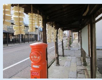
高田の雁木の街並み